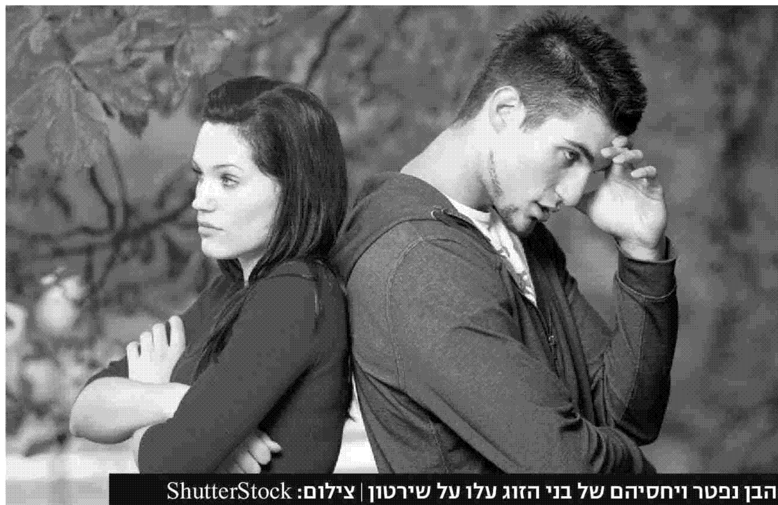
הבן נפטר ויחסייהם של בני הזוג עלו על שירטון

כארבע שנים לאחר שלקה בתרדמת (קומה), נפטר הבן ויחסייהם של בני הזוג עלו על שיי רטון. האישה הגישה תביעה למתן גט בבית הדין הרבני ובמקביל הגישה בקשה לקביעת מזונות ילדים ומזונות אישה לבית המשפט למשפחה בפתח תקוה. במסגרת הבקשה